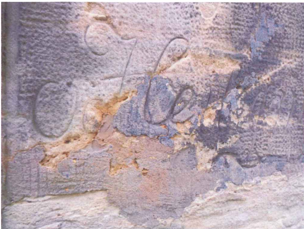
Detail poškozeného písma – staré tmely, drolivý kámen.