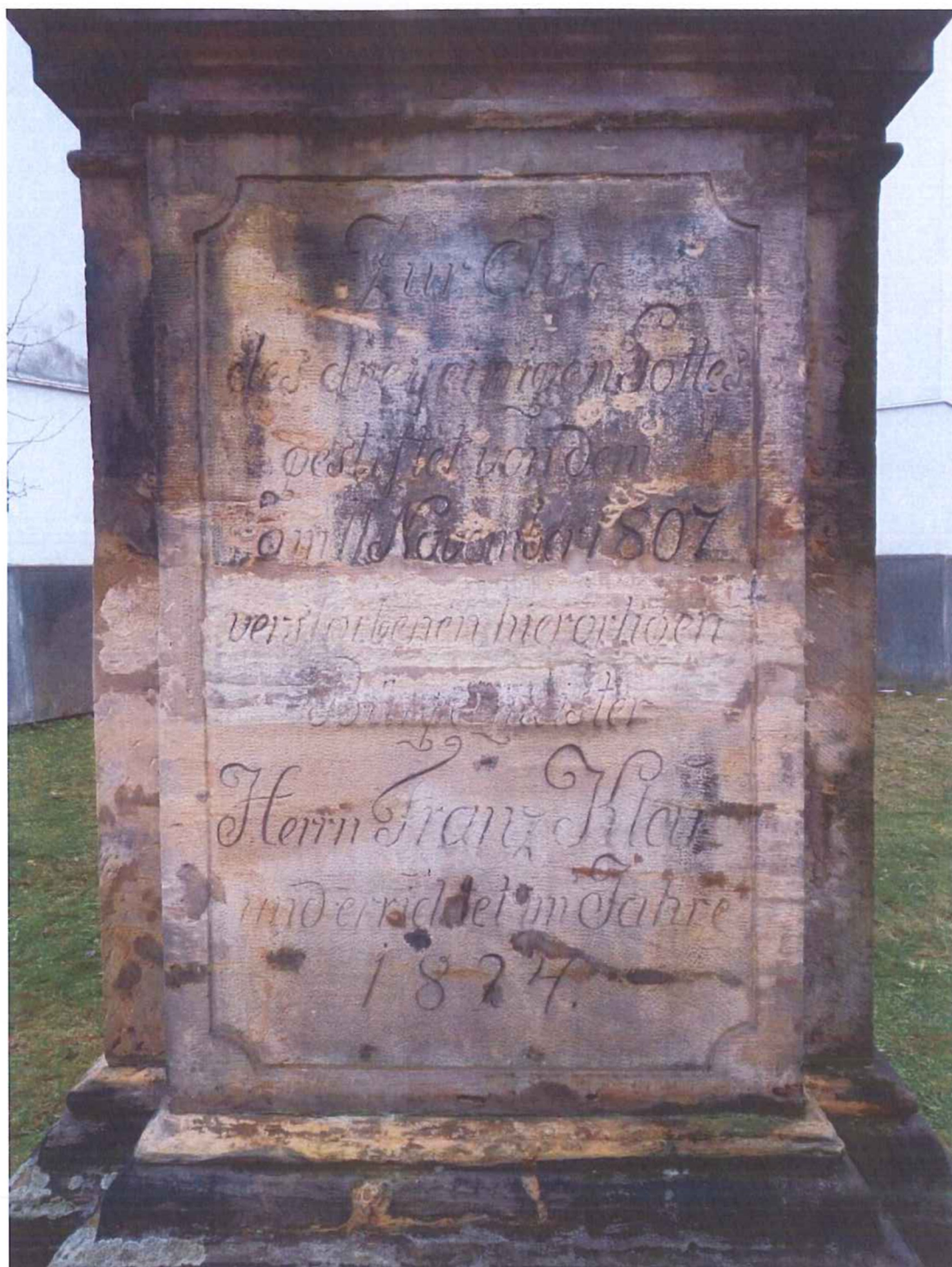
Poškozený nápis na čelní straně podstavce – Horní část kamene je poškozena tmavými depozity, v prostřední části je viditelné poškození zasolením kamene, zvětráváním a ubýváním hmoty kamene. Značné množství cementových vysrávek barevně neodpovídají originálu a jsou dožité.