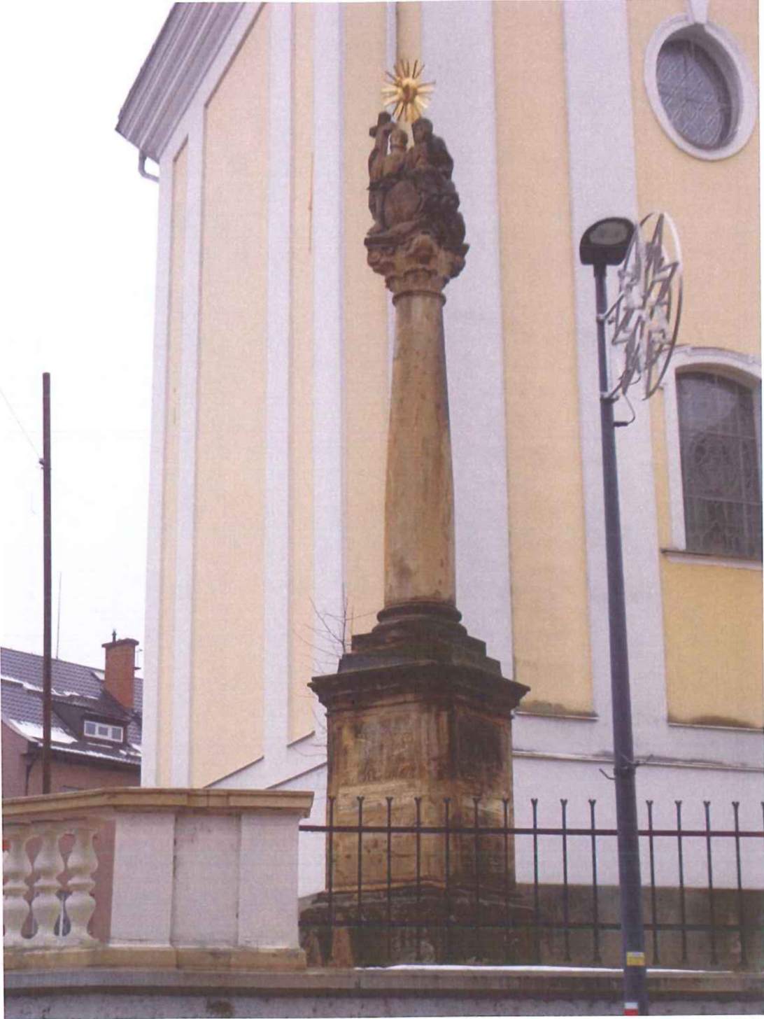
Celkový pohled na památku.