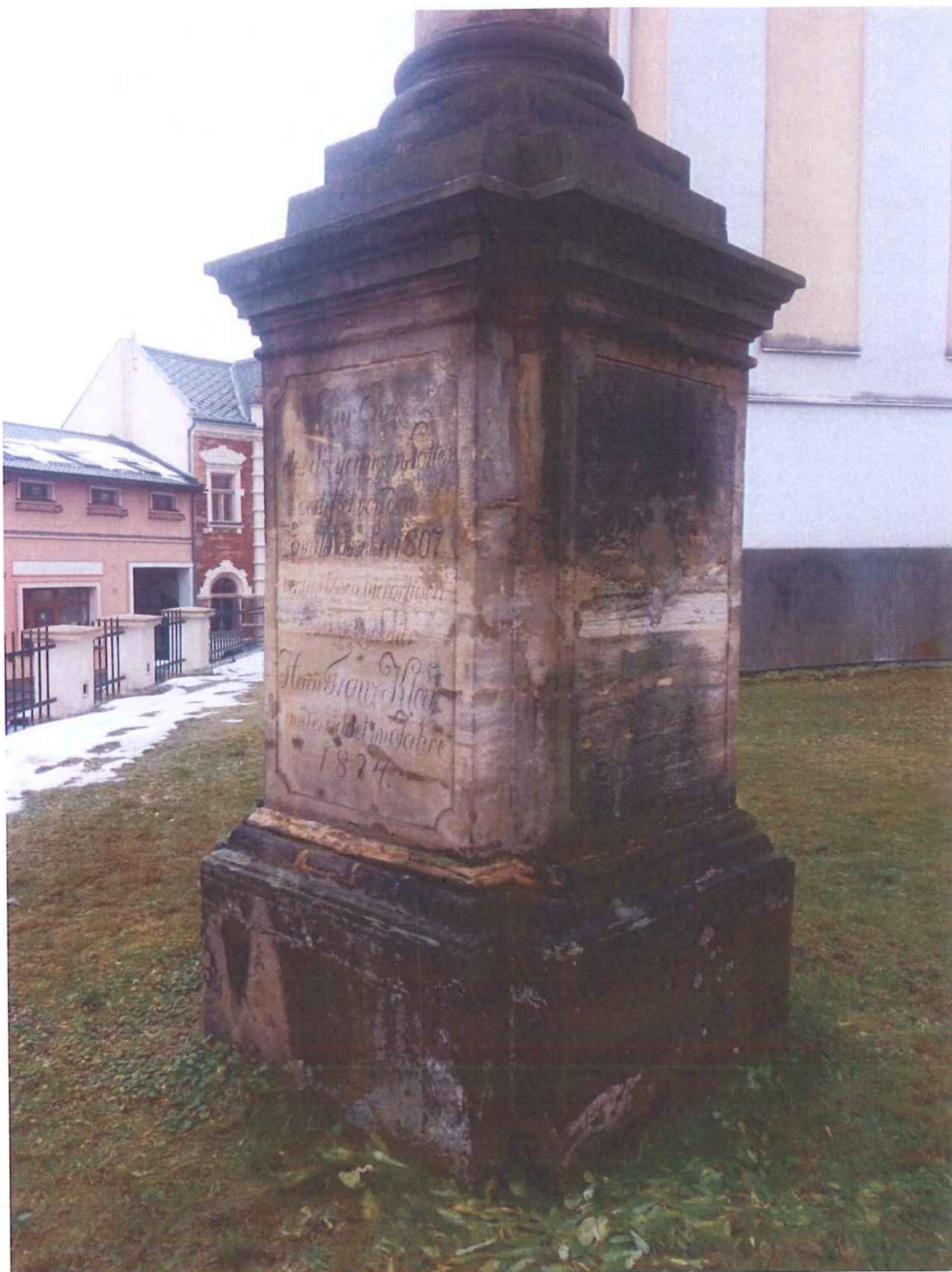
Památka se nachází ve špatném stavu, spodní masivní podstavec je ze všech stran poškozený zvětráváním kamene a zasolením kamene. Nápisy na podstavci jsou lokálně naprosto nečitelné a nejsou místy dochované z důvodu právě zvětráváním a ubýváním hmoty kamene.