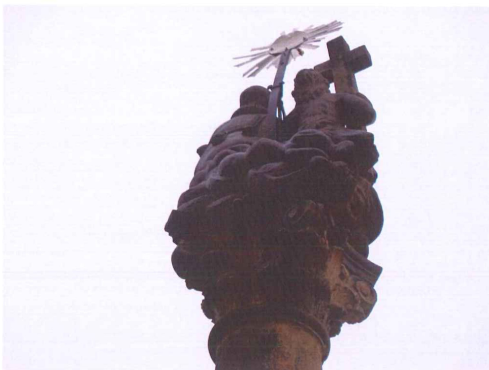
Vrcholové sousoší Nejsvětější Trojice – Povrch kamene je poškozen tmavými depozity, v místech dešťových stínů se vytváří sádrovcovými krusty.