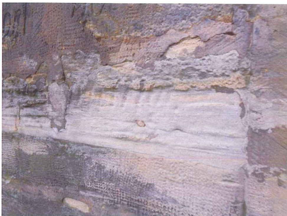
Detail degradovaného kamene v místě původního nápisu.