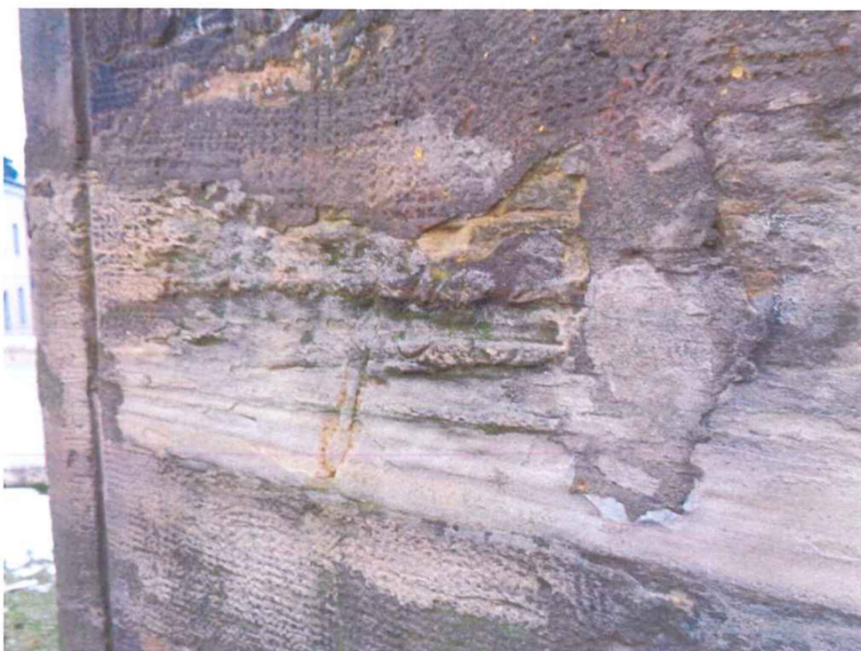
Detail poškození nápisu v zadní straně vlivem koroze kamene.