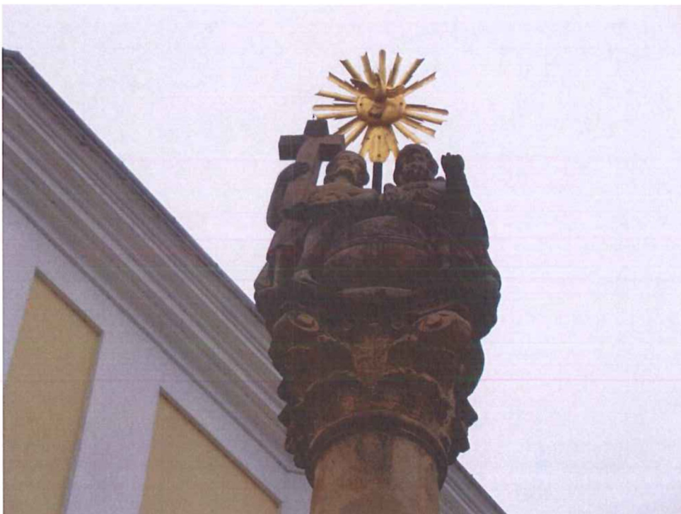
Vrcholové sousoší Nejsvětější Trojice - povrch kamene je pokryt tmavými depozity. V místech hlavice, především na akantových listech se vytváří sádrovcové krusty. Horní břevno kříže, které drží Kristus je cementový doplněk z předchozích oprav. Pozlacená holubice se svatozáří nejeví známky poškození.