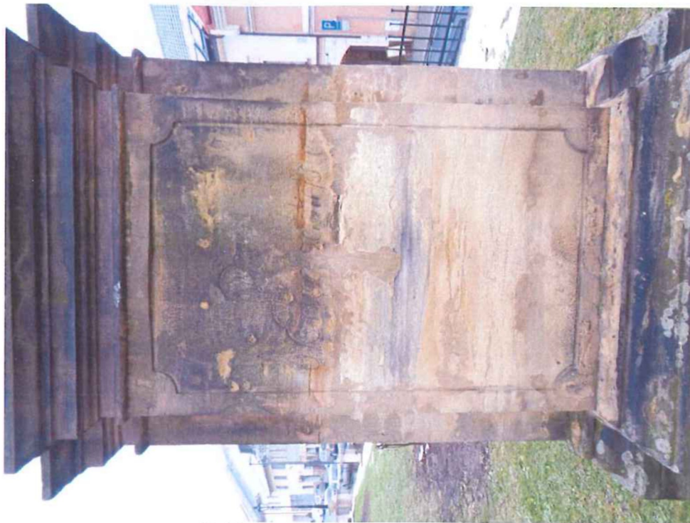
Poškozený nápis na boční straně.