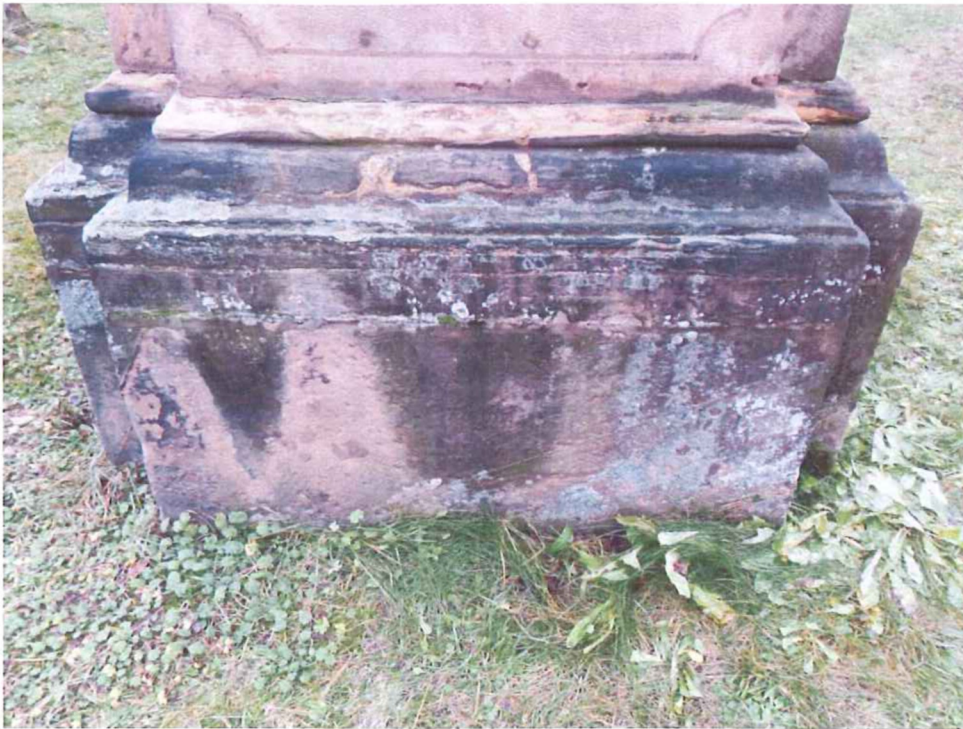
Poškozená spodní část podstavce – biologické napadení, tmavé depozity.