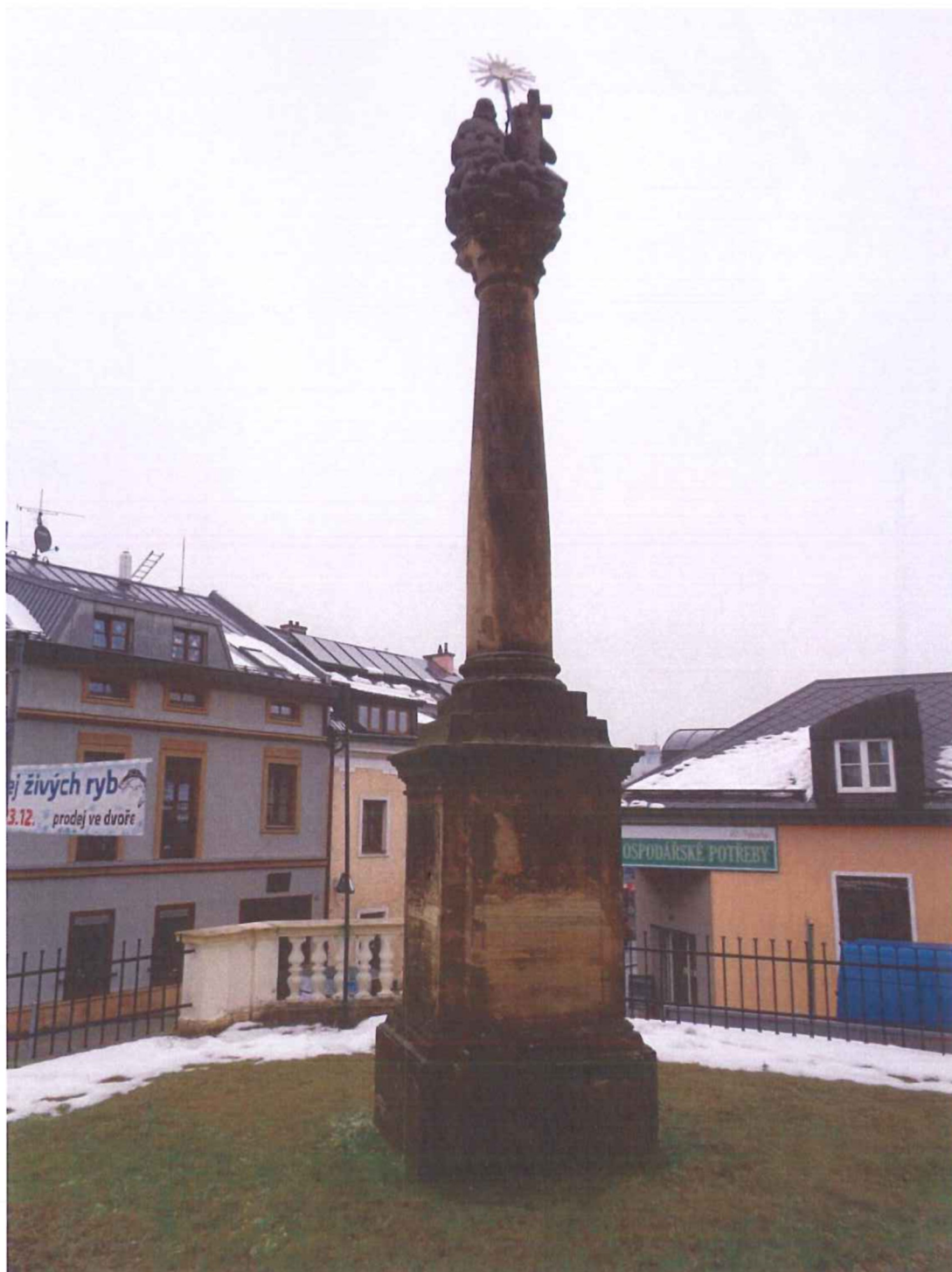
Zadní pohled na památku.