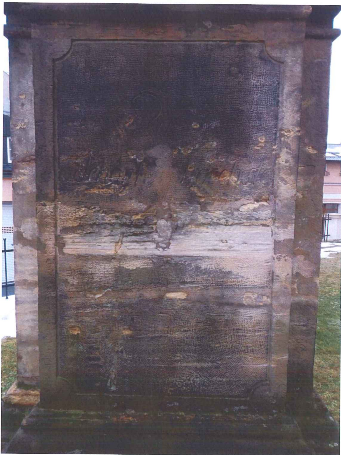
Poškozený nápis na zadní straně podstavce - poškození tmavými depozity, v prostřední části je viditelné zasolení kamene, zvětrávání a ubývání hmoty kamene. Nápis v prostřední části není dochovaný vlivem povrchové degradace kamene.