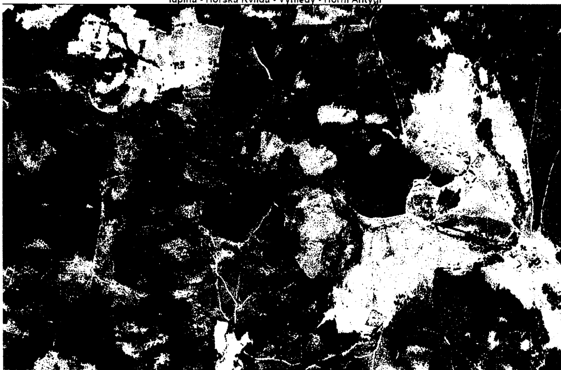
lupina - Horská Kvilda - Vyhledy - Horní Antýgl