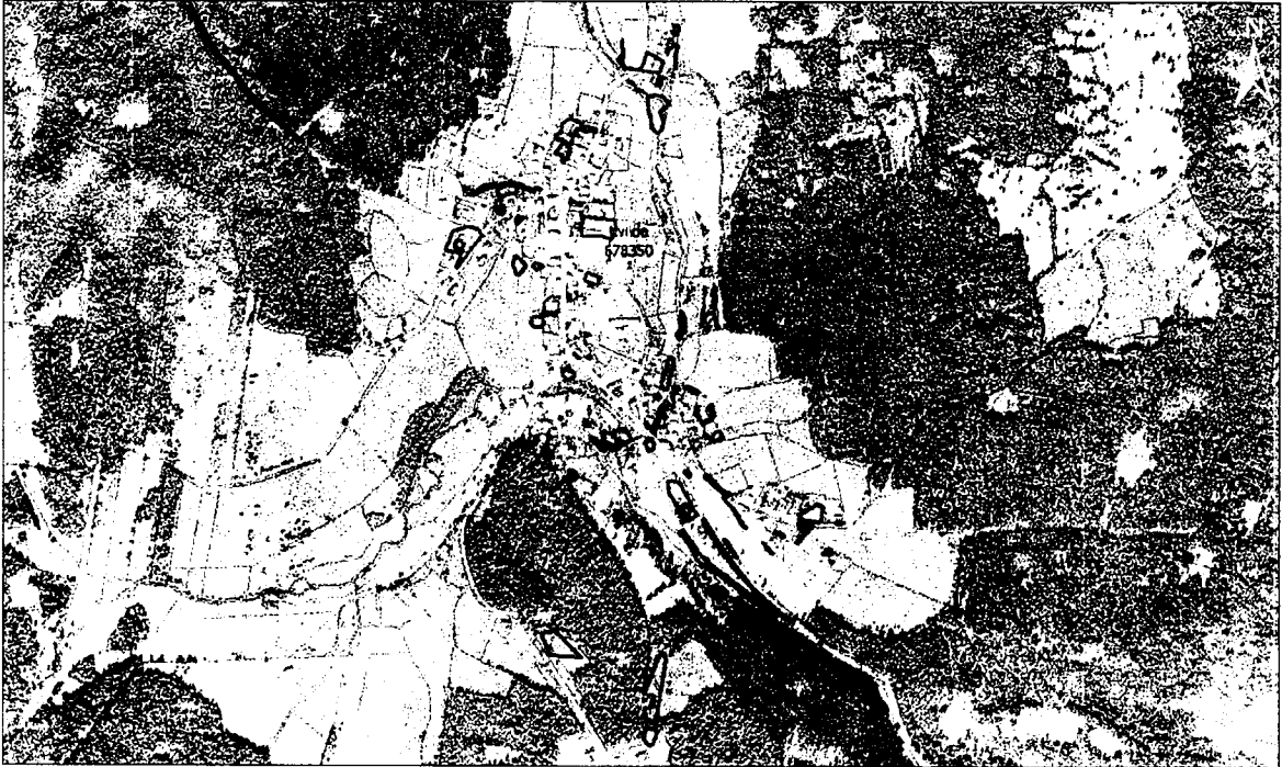
Kvilda-obec likvidace lupiny mnoholiste k.ú. Kvilda