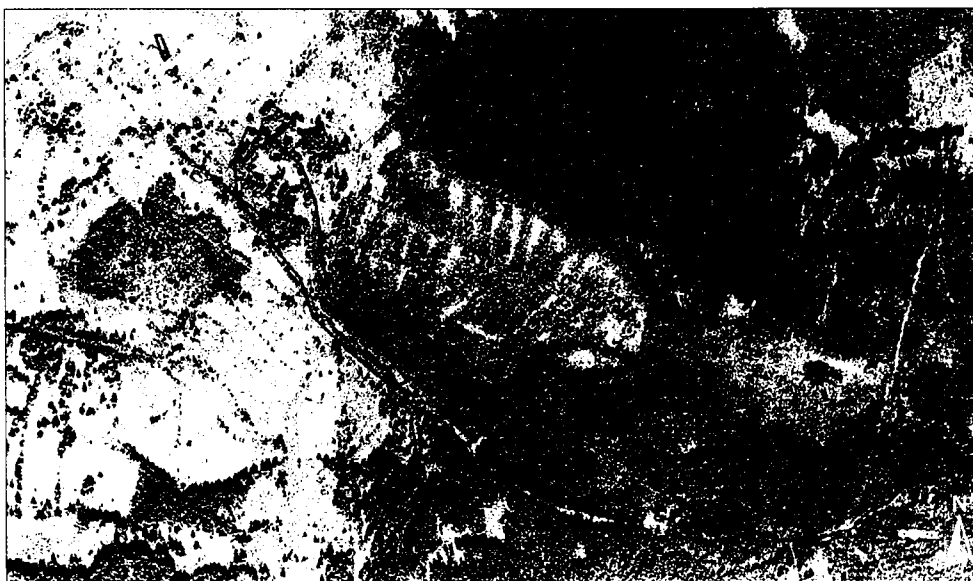
Knížecí pláň likvidace lupiny mnohohlístě k.ú.Knížecí pláň,k.ú.Horní Světlé Hory