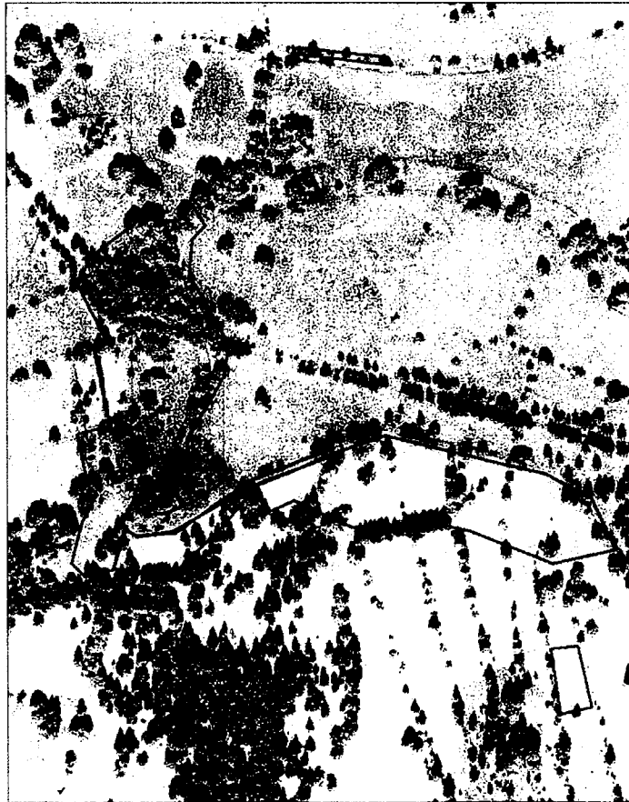
Knížecí pláň - kostel likvidace lupiny mnohohlístě k.ú.Knížecí pláň