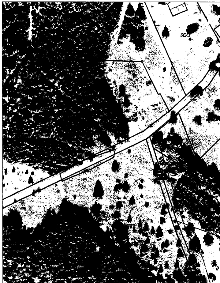
Bučína likvidace lupiny mnoholisté k.ú. Bučina u Kvildy

Maximální stanovená cena: 208 359,00 Kč bez DPH