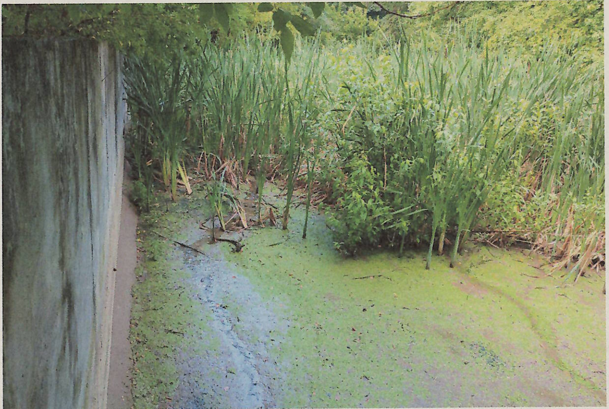
3) Částečně zazemněný a zarostlý prostor uvnitř retenční nádrže (pohled shora)