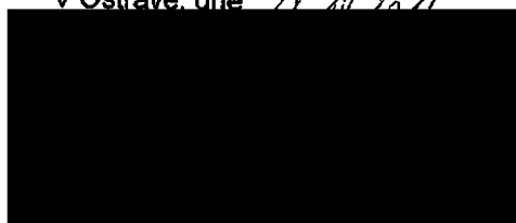
Mgr. Jiří Jureček, starosta Statutární město Ostrava Městský obvod Hošťálkovice