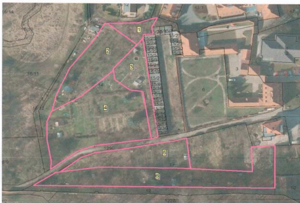
Mapa lokalita 1-1 až 1-6 -