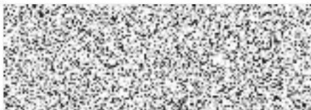
Radek Saska na základě plné moci