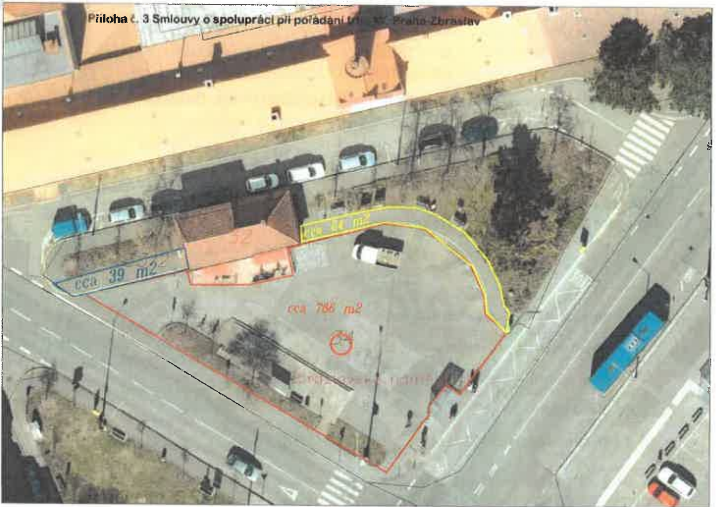
Příloha č. 3 Smlouvy o spolupráci při pořádání třídních akcí Praha-Zbraslav