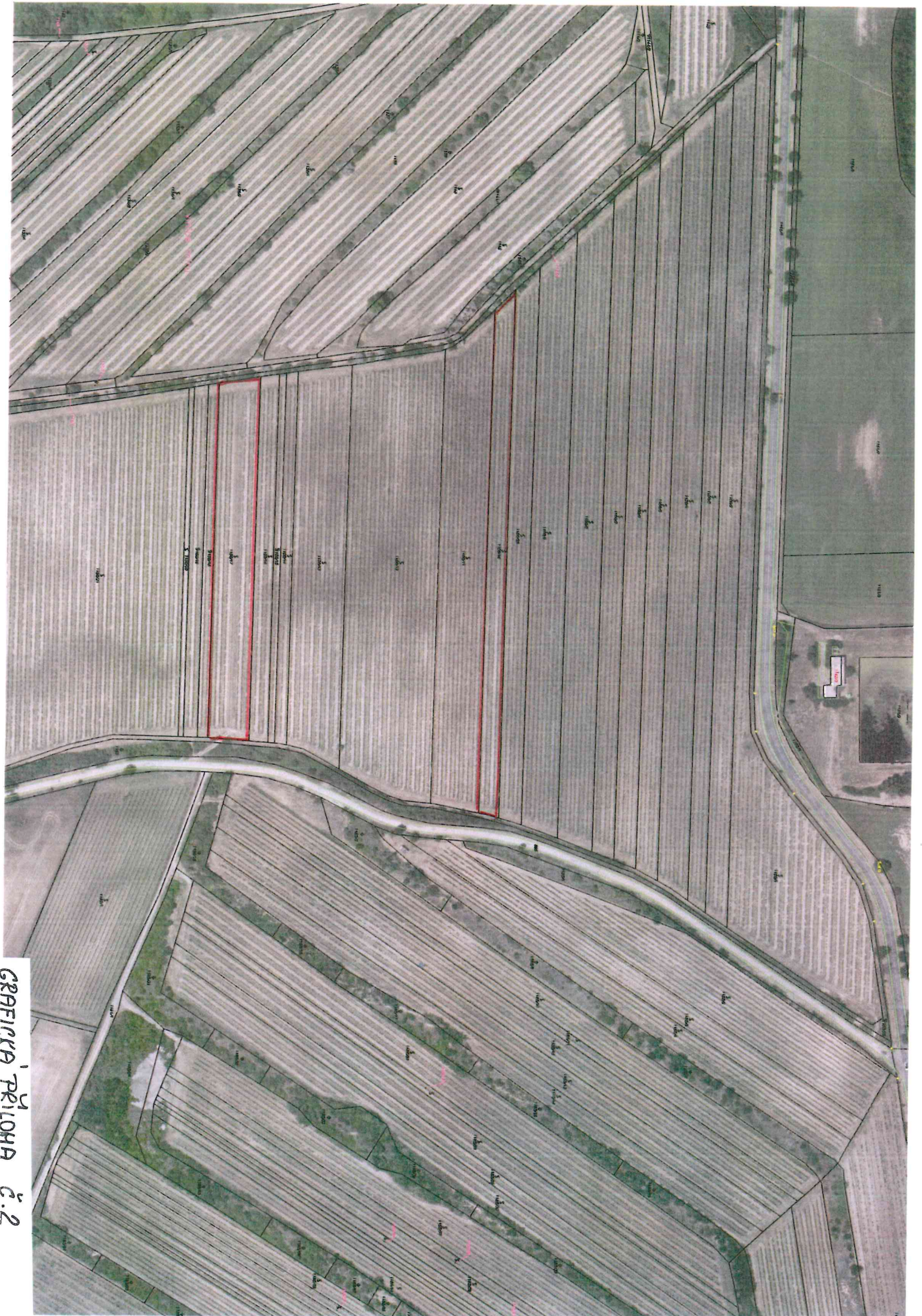
ГРАФИКА ПРІЛОЖА 2.2