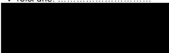
za Město Telč starosta města Mgr. Vladimír Brtník