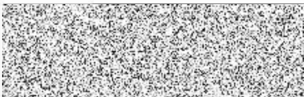
PD stavby „vymena oken objektu školní jídelny“