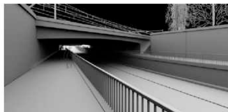
SUDOP – stávající podoba podjezdu DUR+DSP