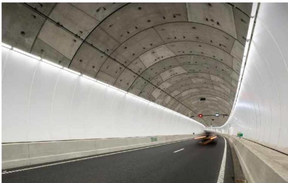
Bentham Crouwel Architects: Streamlined route – ukázka zahraničního referenčního projektu I