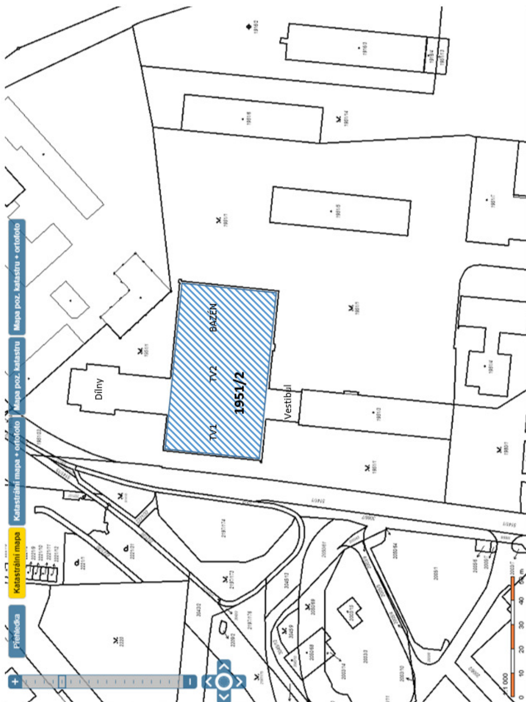
Příloha č. 1 Smlouvy – Oblast prováděných zaměření a průzkumů objektu 1951/2