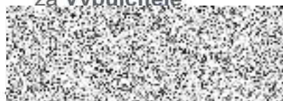
JUDr. Ladislav Máca ředitel

ZAŘÍZENÍ SLUŽEB PRO MV Příspěvková organizace 101 00 Praha 10, Přípotoční 300 IČO: 67779999 DIČ: CZ67779999 -175- ražítko