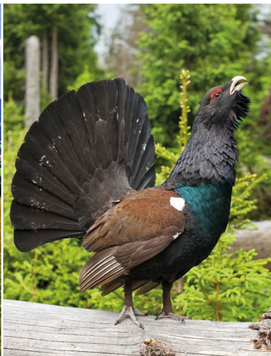
Tetřev hlušec