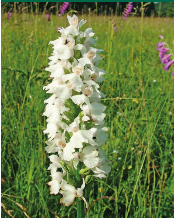
Prstnatec Fuchsův

Beskydy jsou známé především svými pralesy a výskytem tří druhů velkých šelem – rysa, vlka a medvěda. Zatímco rys a v posledních letech i vlk u nás žijí i jinde, na medvědy (či spíše jejich stopy) narazíte zatím jen v západokarpatských lesích, kam se občas zatoulají ze sousedního Slovenska. Cestu jim však komplikují nejen silnice s hustým provozem, ale i pytláci. Při troše štěstí můžete potkat i řadu jiných živočichů, z nichž mnozí jsou typičtí právě pro Karpaty: drobný obojživelník čolek karpatský, podivuhodný modrý plž – modranka karpatská, nebo i relativně hojná zmije. V lesích hnízdí pralesní druhy ptáků: tetřev hlušec, jeřábek, čáp černý, datel, strakapoud bělohřbetý.