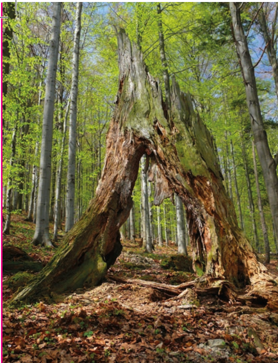
Prales v Mionší