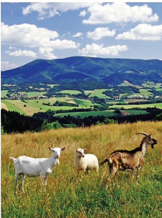
Pastva koz pod Radhoštěm