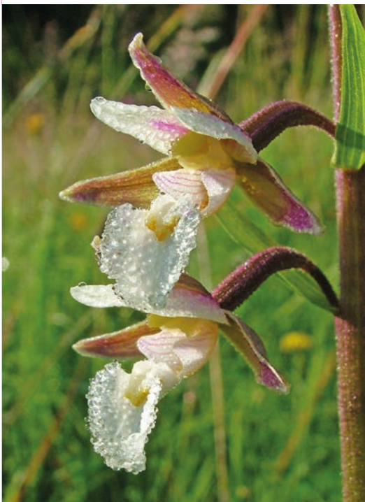
Kruštík bahenní