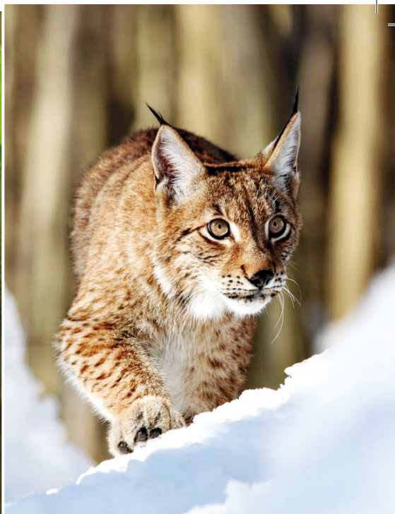
Rys ostrovid

Krajina táhlých horských hřebenů, hlubokých údolí, rozlehlých lesů, rozkvetlých luk, dřevěných kostelů i chalup. Krajina, jakou najdete jen na moravsko-slovenském pomezí a pak dál na východ, zkrátka Karpaty. Jediné území, kde u nás žijí tři velké šelmy, rys, vlk a medvěd.