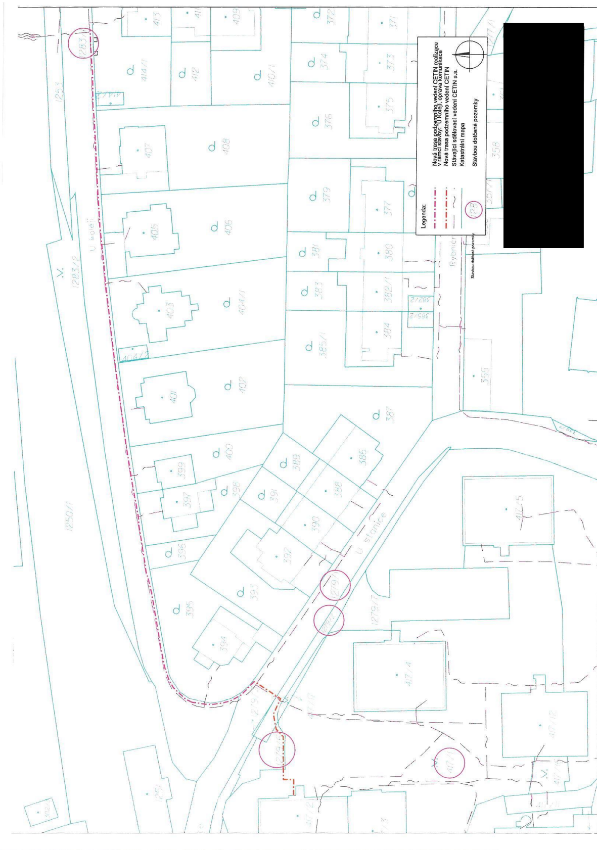
Příloha č. 1