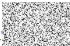
ředitel odboru majetkoprávního a veřejných zakázek