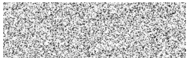
vedoucí referátu správy majetku

Smluvní strany souhlasí s uveřejněním této smlouvy v plném rozsahu v Registru smluv ČR.