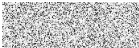
razítko a podpis pojistníka