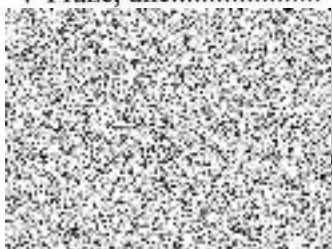
REALIA Dobrá s.r.o.