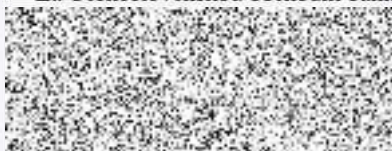
Asistent Firemního bankéře

Za Československou obchodní banku, a. s.