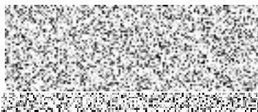
vedoucí Oddělení městské energetiky