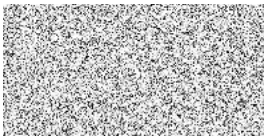
Střední odborné učiliště opravárenské, Králíky, Předměstí 427