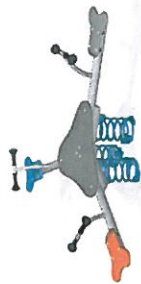
KPL117 - trojvahadlová houpáčka se surfovým prknem uprostřed,