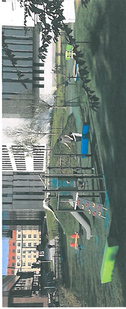
PCM100303 polyfunkční sestava 1 věž

nerozovým skluzem kovová konstrukce Antivandal, podlaha ve věži z HPL, nerozovým skluzem nerozový hasičský skluz, šikmá lezecká stěna s úchyty, lahová šplhací stěna