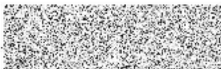
ředitelka SJ (dodavatel)