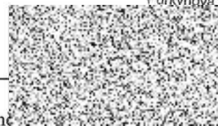
JUDr. Zdeněk Nemocnice Vyškov, příspěvková organizace

Nemocnice Vyškov, příspěvková organizace Purkvňova 36, 682 01 Vyškov DIČ: CZ00839205 fax: 517 315 118 195