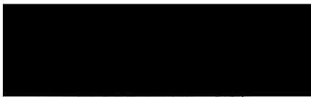
pořadatel Dům kultury v Kroměříži, p. o.