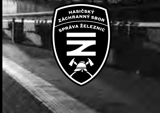
znak na fotografii