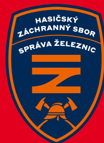
znak na červené ploše