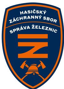
základní barevné provedení