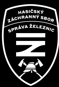
znak na černé ploše