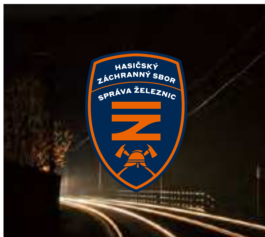
znak na tmavé fotografii