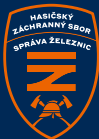
znak na modré ploše