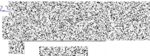
ředitel odboru majetkoprávního a veřejných zakázek