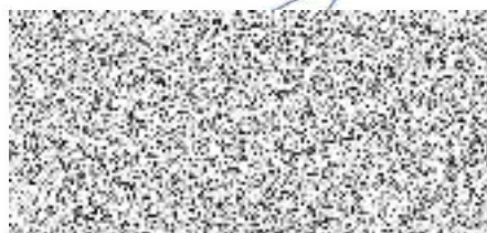
jednatel za zhotovitele