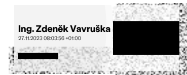
Městská část Praha 20