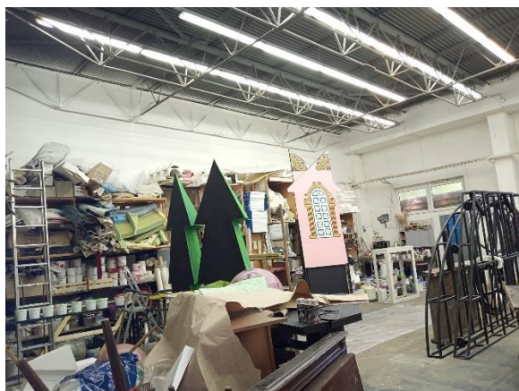
Současné prostory dílny dekorací MDO na Zikově ulici.

Od roku 2018 probíhá příprava projektu vybudování nového zázemí pro dílnu dekorací a pro další dlouhodobý záměr MDO a Statutárního města Olomouce, kterým je vybudování kreativního a edukačního centra pro veřejnost. Do přípravných jednání vstoupil další významný subjekt, a to Střední škola polygrafická, Olomouc, Střední novosadská 87/53, příspěvková organizace Olomouckého kraje. Do portfolia této střední školy patří Reprodukční grafik pro média, Tiskař na polygrafických strojích, Polygrafie a Obalovaná technika. Pro spojení obou potřeb a záměrů MDO a střední školy byl rozhodující fakt vzniku nového studijního oboru jevištní technolog, o který se souhlasem svého zřizovatele bude střední škola žádat pro školní rok 2023/2024.