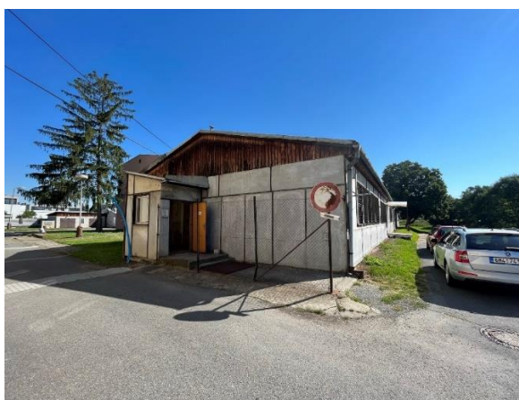
Současné prostory pro praktickou výuku SŠP Olomouc na ulici Střední novosadská.

Všechny výše uvedené skutečnosti jsou uvedeny v příloze č. 1 této studie proveditelnosti – Fotodokumentace současného stavu.