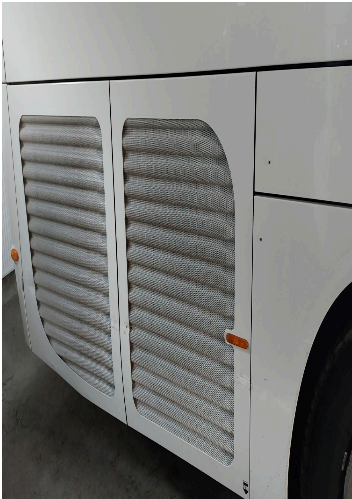
Vyklepání a lakování krytu klimatizační jednotky