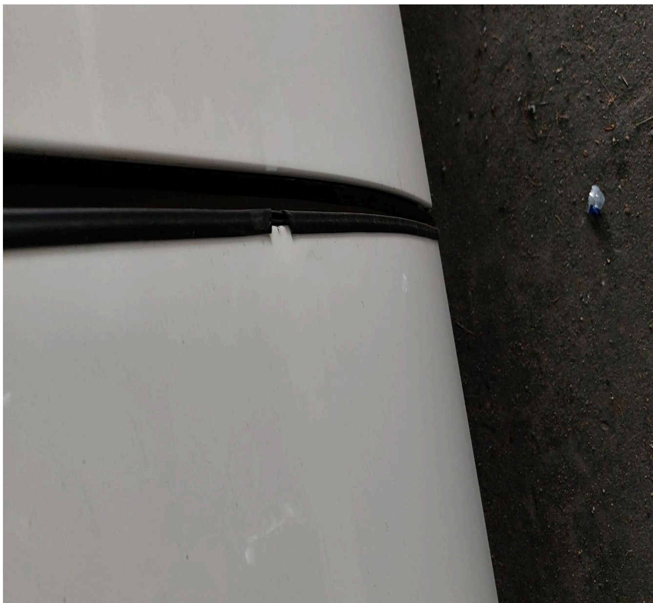
Zadní dveře, přední hrana dveří