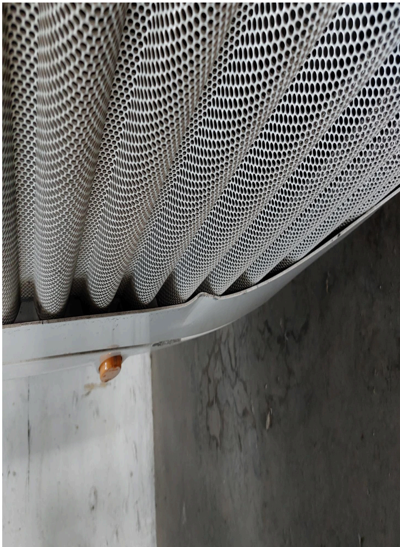
Vyklepání s lakováním - Kryt klimatizační jednotky, pravá strana Pravý boční díl zadního nárazníku