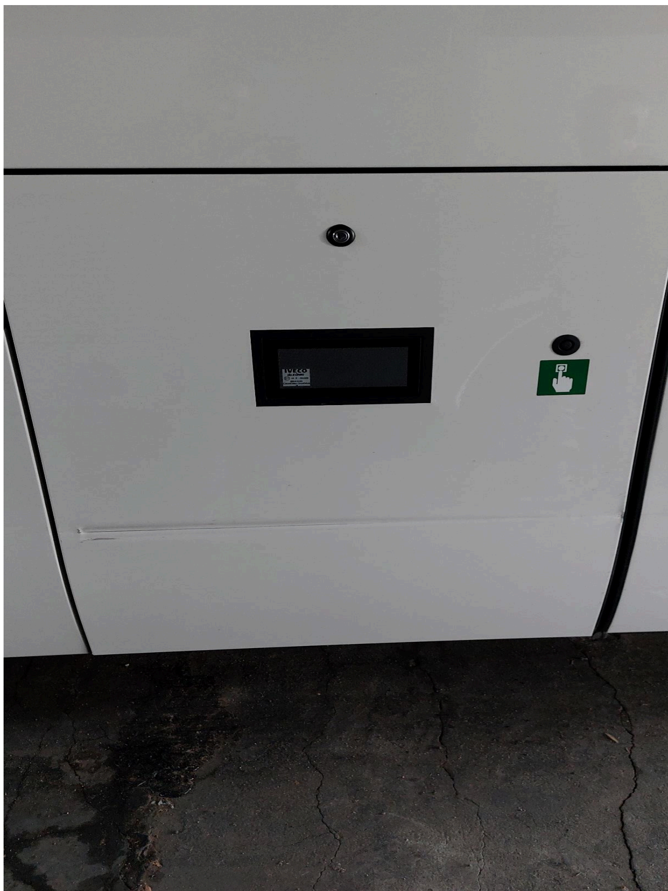
Výměna krytu (víka) zavazadlového prostoru, pravá strana za zadními dveřmi (originální ND)