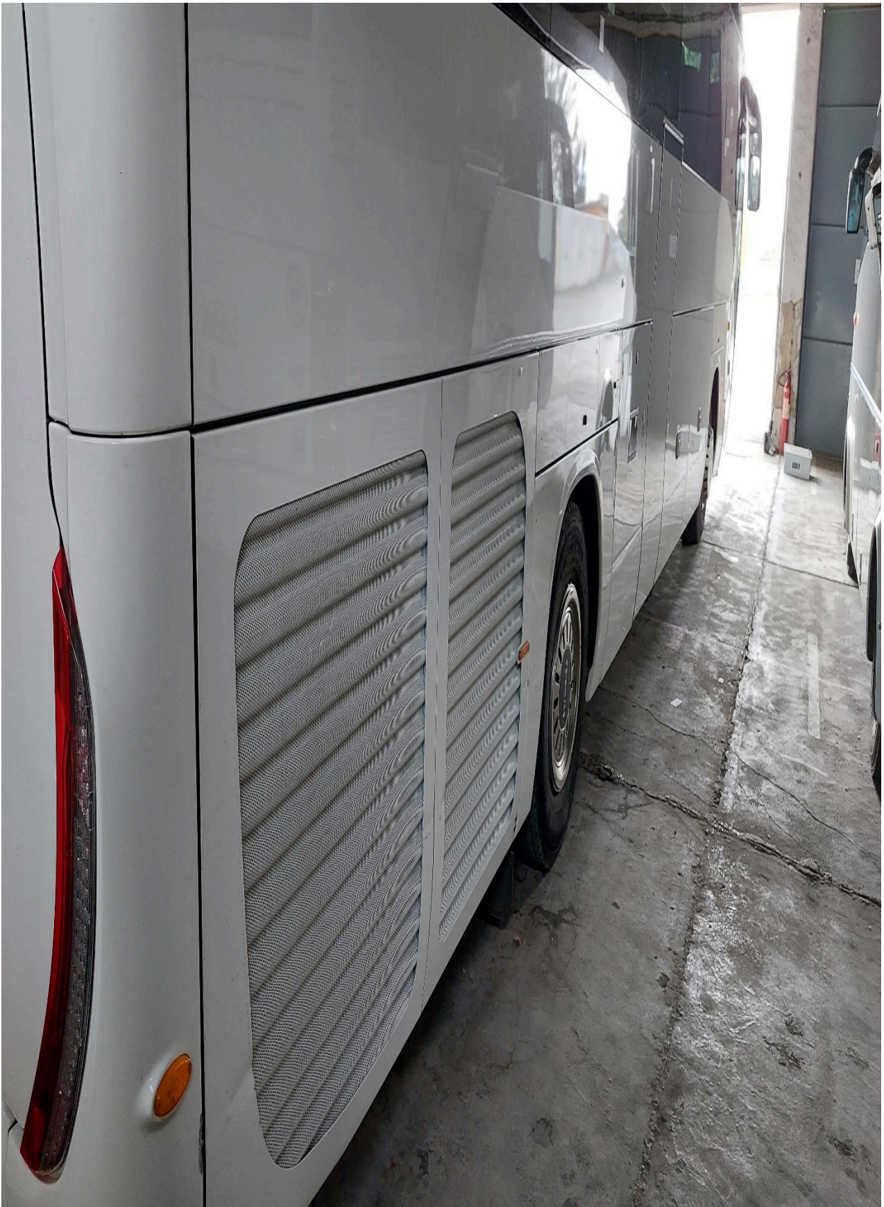
Vyklepání krytu klimatizační jednotky s lakováním, pravá strana