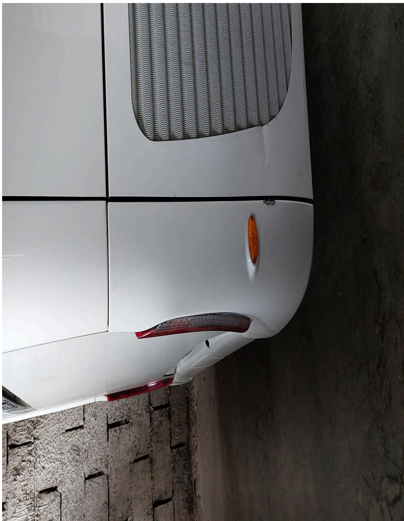
Tmelení a lakování pravého bočního dílu zadního nárazníku