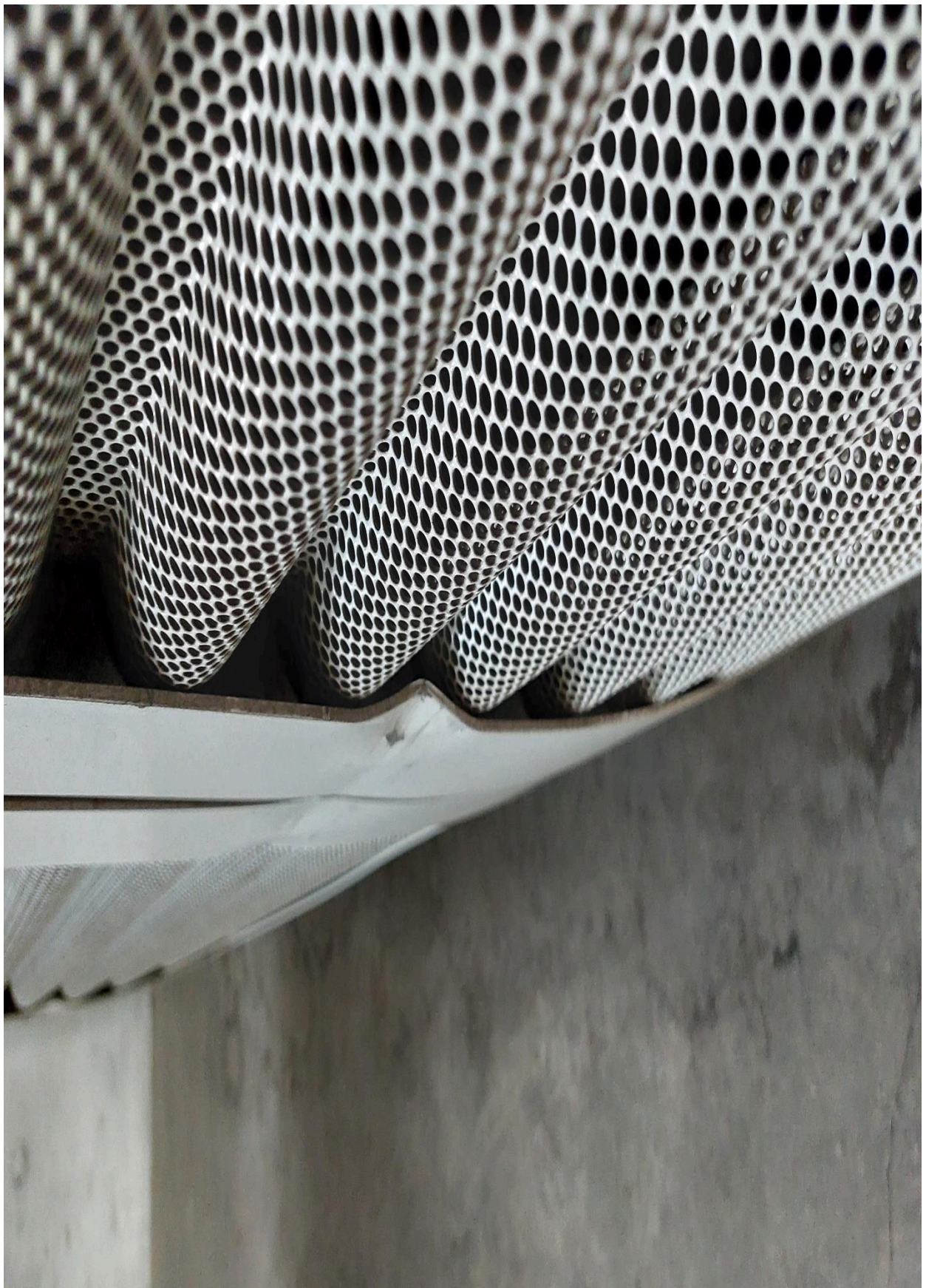
Vyklepání krytu klimatizační jednotky s lakováním, pravá strana