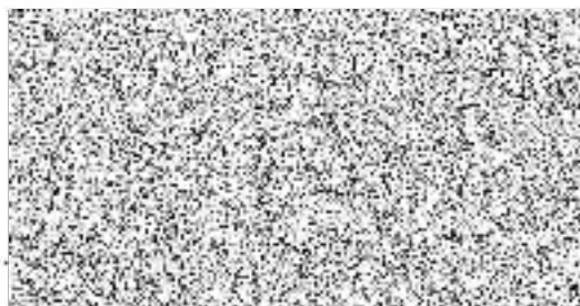
jednatel RMI, s.r.o.