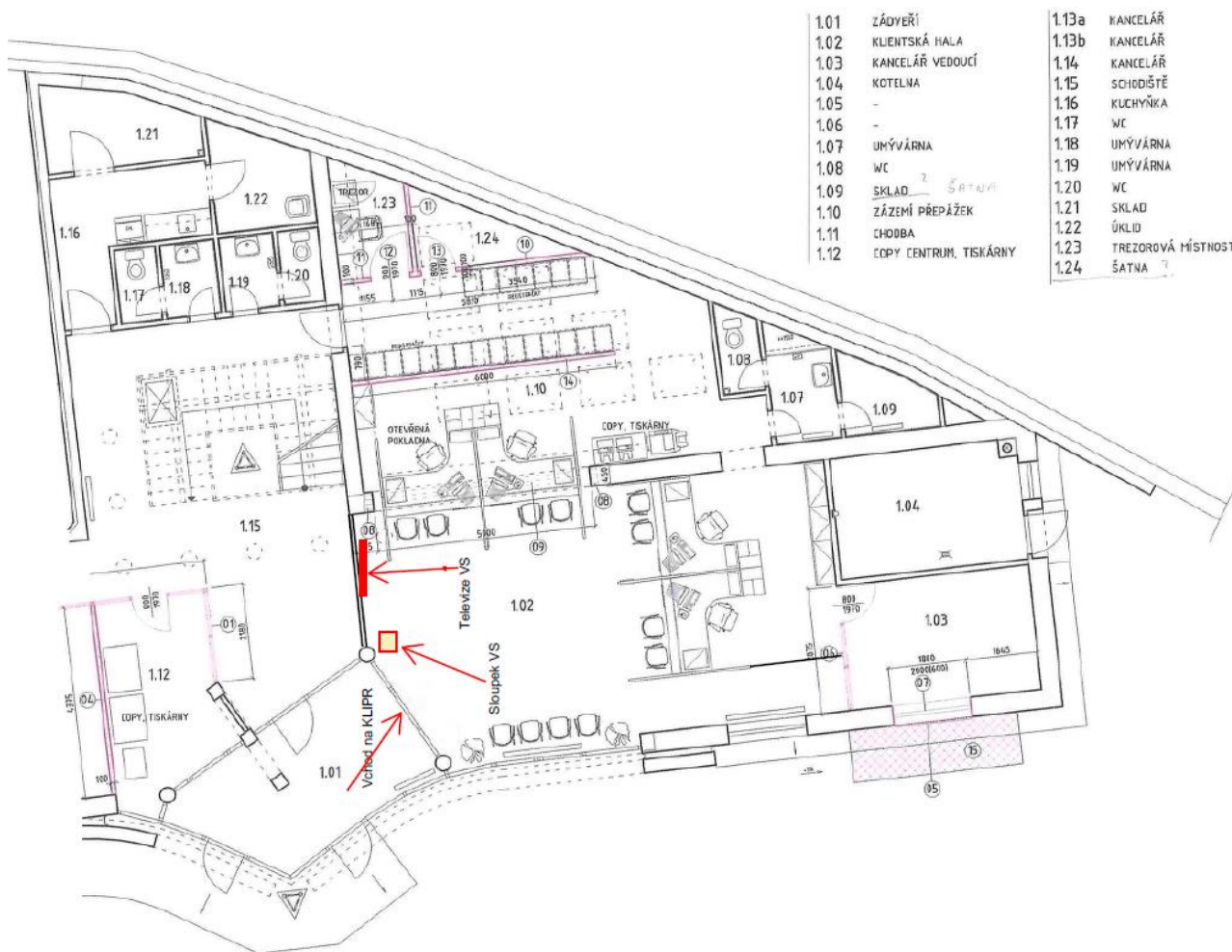
Příloha č. 2 – mapové podklady clientského pracoviště Ústí nad Orlicí