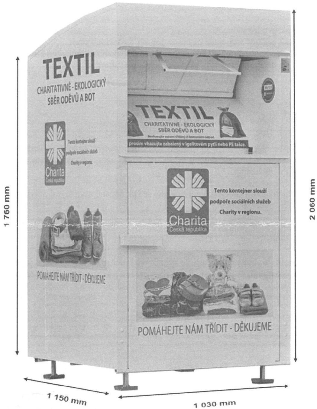
Schéma kontejneru na textil