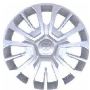
16" ocelové disky kol s ozdobnými kryty (5 trojitých paprsků) Pro výbavu Shuttle