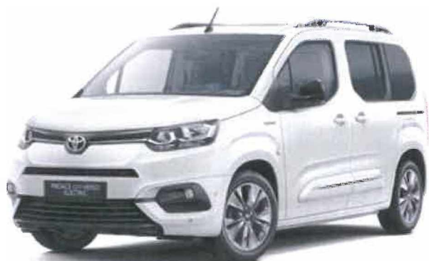
EPR Bílá ledová standardní lak bez příplatku