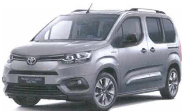
KCA Stříbrná atomická metalický lak 15 000 Kč