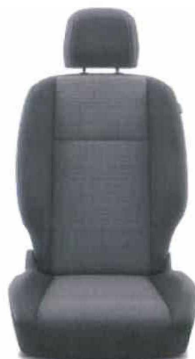
Látkové čalounění sedadel Manhattan Pro výbavu Shuttle a Family Comfort