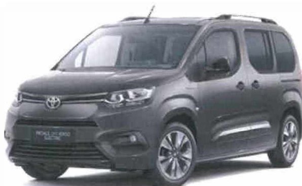
EVL Šedá tmavá metalický lak 15 000 Kč