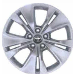
17" litá kola (5 zdvojených paprsků) Pro výbavu Family Comfort