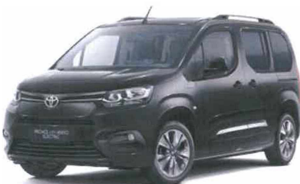
KTV Černá vesmírná metalický lak 15 000 Kč