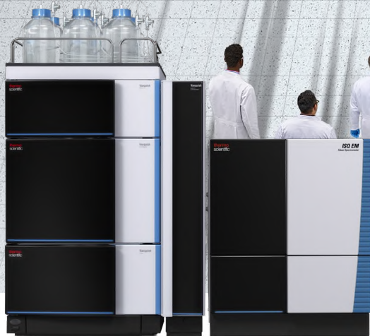
ISQ EM Single Quadrupole Mass Spectrometer