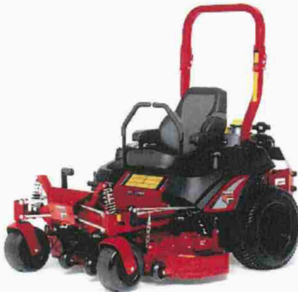
FERRIS ISX 2200 / 132 cm

Profesionální sekačka s nulovým poloměrem otáčení FERRIS ISX 2200 o záběru sečení 132 cm