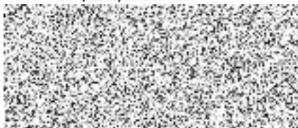
Radek Saska na základě plné moci