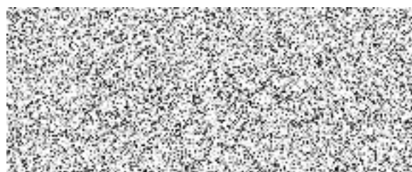
prezident Českého červeného kříže