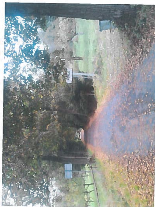
Silnice III/29014 - Peklo, rekonstrukce silnice