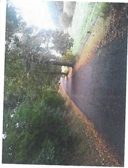
Silnice II/29014 - Peklo, rekonstrukce silnice