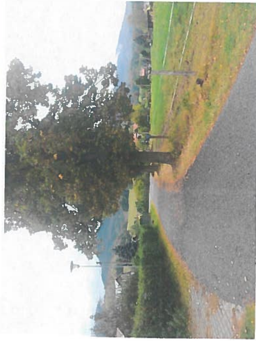
Silnice III/29014 - Peklo, rekonstrukce silnice