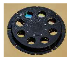
8 filters wheel