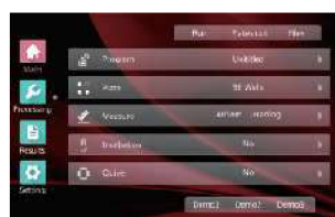
7" touch screen