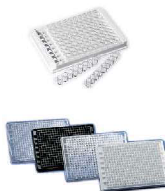
96 well or 384 well microplate