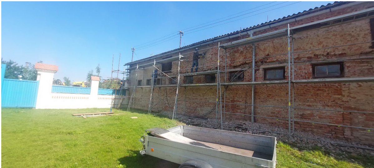
Z1 – drážka ve fasádním zdivu