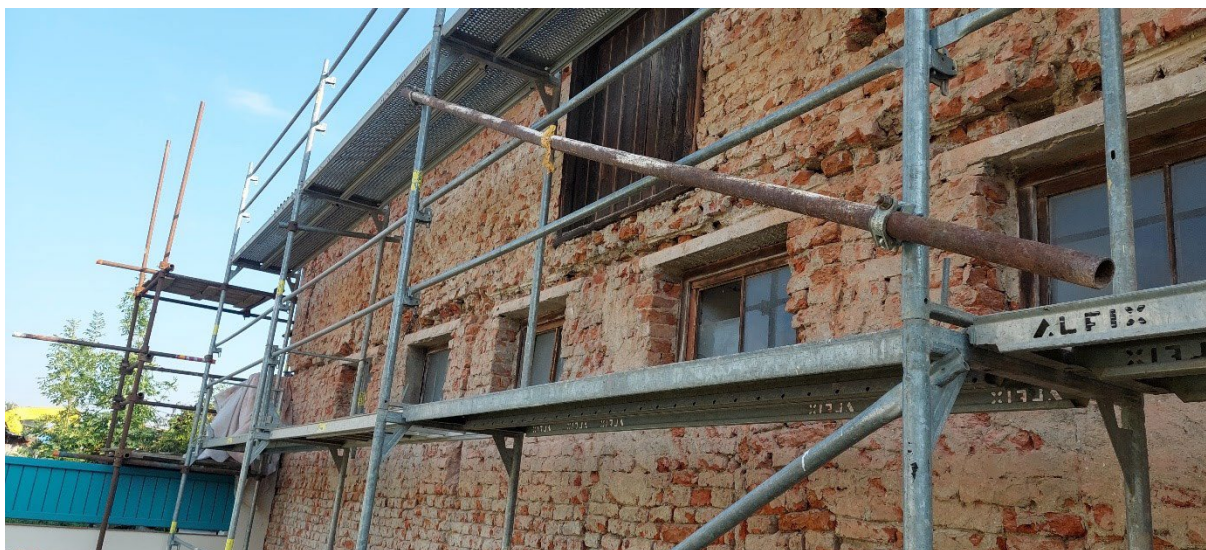
Z1 – stav zdiva po odstranění omítek