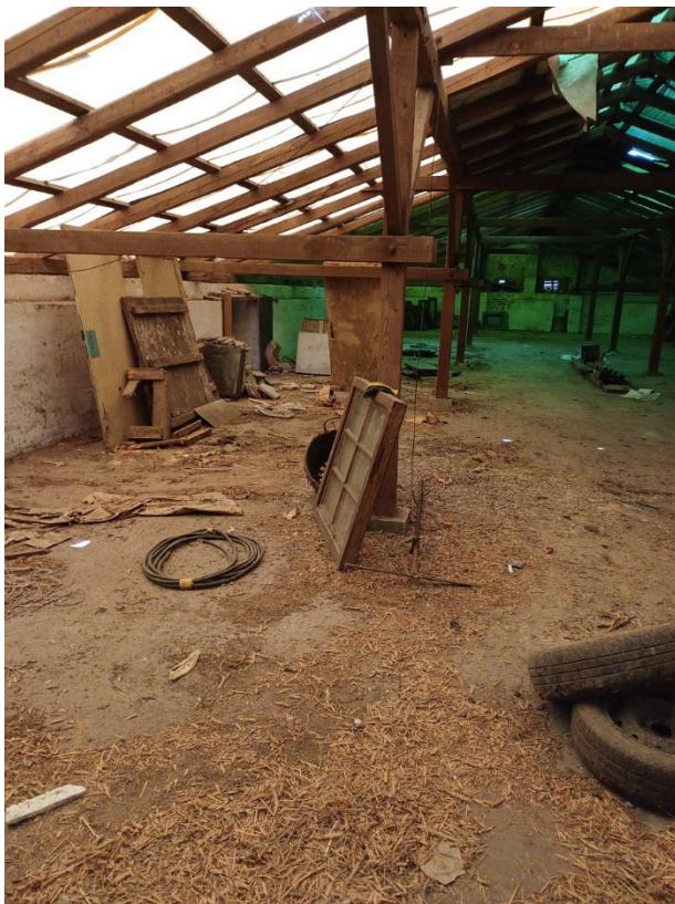
Z2 – půdní prostor