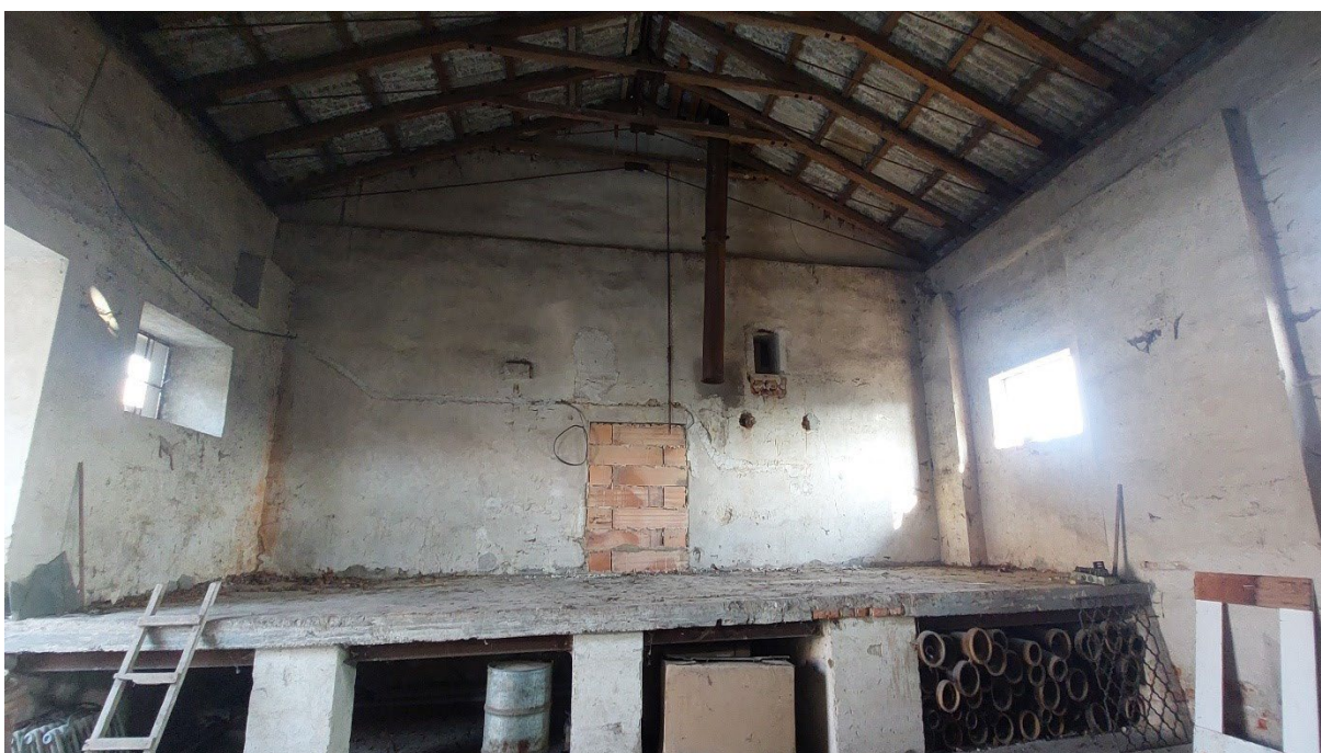
Z8 – železobetonové pódium