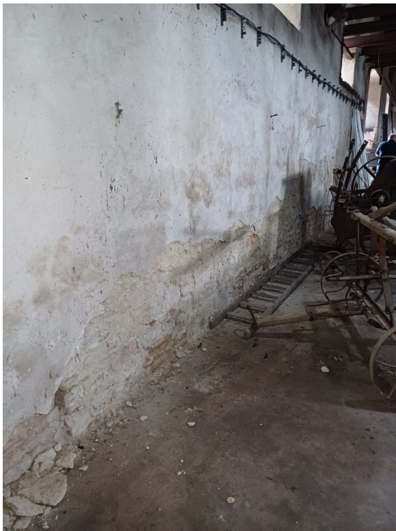
Z4 – vnitřní omítky (vzlínající vlhkost nosného zdiva)