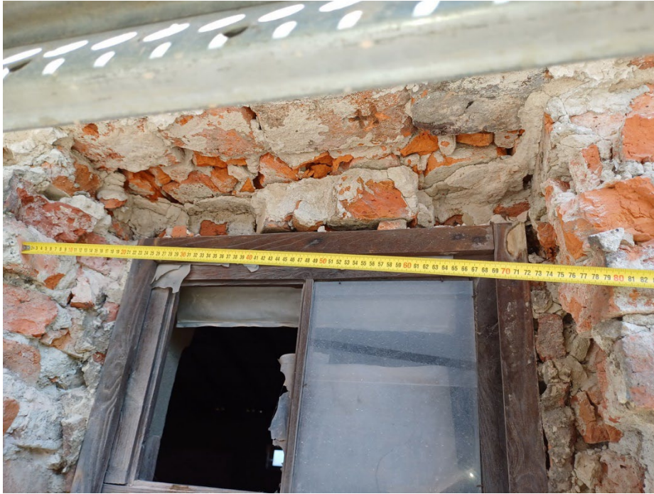
Z3 – nadpraží okna (bez překladů s poškozenou klenbou)