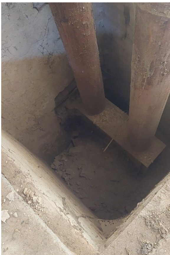
Z7 – otvor v podlaze (původní šachta po technologii zemědělského provozu)