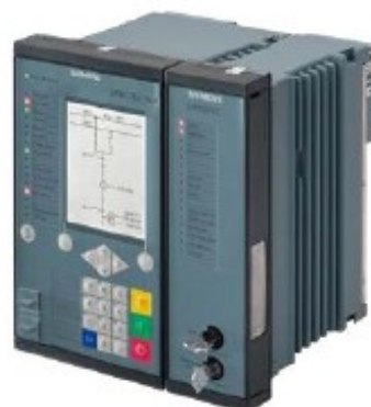
Nadproudová ochrana vývodu SIPROTEC 7SJ85 (přístroj šířky 1/3 x 19 palců až 2/1 x 19 palců)