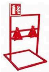
Pol. č. 6