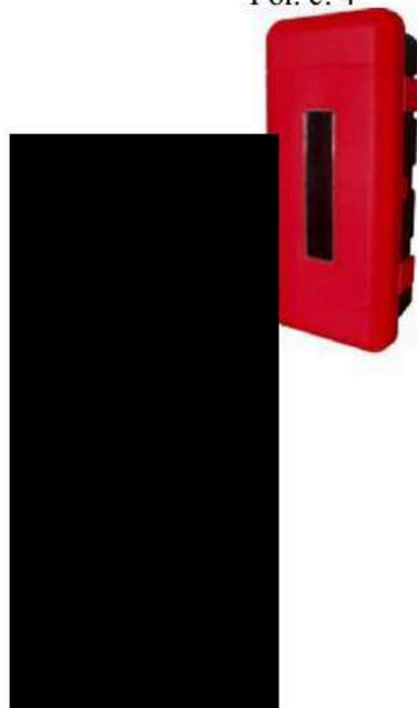
Pol. č. 4