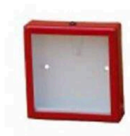
Pol. č. 7