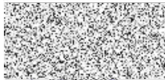
prodávající Zdeněk Dračka