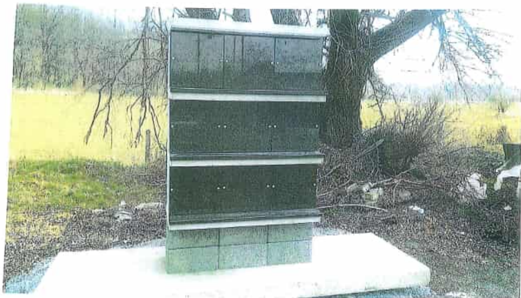
KOLUMBÁRIUM - hřbitov Ivančice investor: Město Ivančice, Telackého náměstí 1966 měřítko: 1: výška z. 4 vypracoval: Ing. Josef Janíček obsah: POUKLO