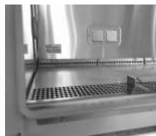
Obr. HeraSafe 2025, opěrky na ruce, pracovní plochy, celoobvodové hermetické těsnění